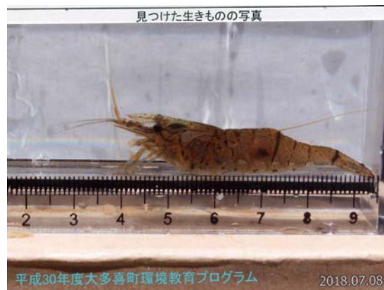
平成30年度大多喜町環境教育プログラム