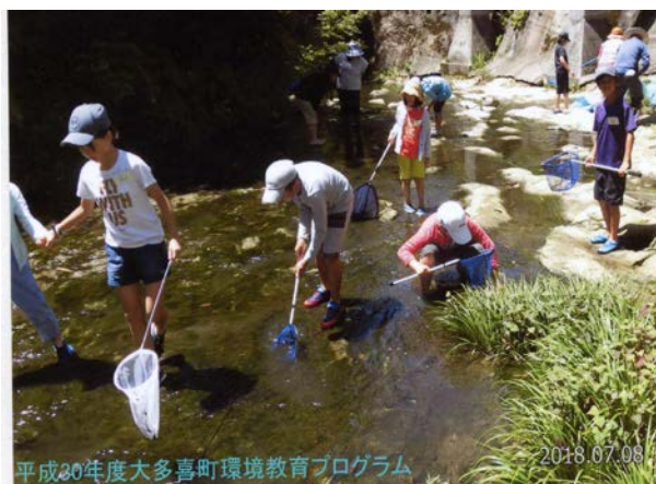
平成30年度大多喜町環境教育プログラム