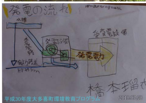
平成30年度大多喜町環境教育プログラム